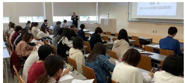
▲基調講演には多くの学生さんが参加